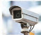
Safety and Security