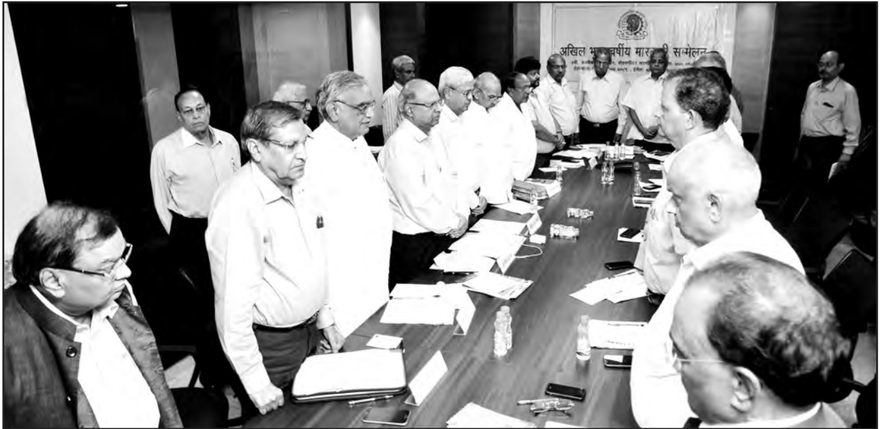
भारत रत्न अटल बिहारी वाजपेयी को मौन श्रद्धांजलि।