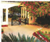
Privilege access to IBIZA Club