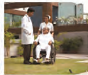
24 x 7 Medical care