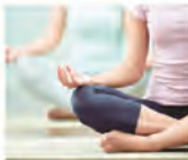
Yoga & meditation