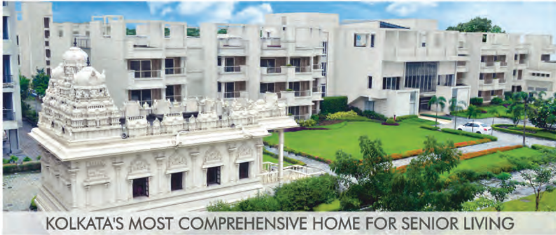
KOLKATA'S MOST COMPREHENSIVE HOME FOR SENIOR LIVING