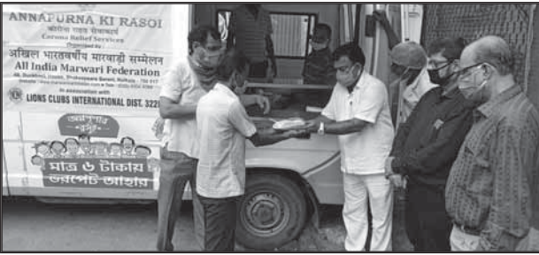
२२ सितम्बर २०२० को मारवाड़ी रिलीफ सोसायटी अस्पताल, बड़ाबाजार के समक्ष निःशुल्क भोजन वितरण