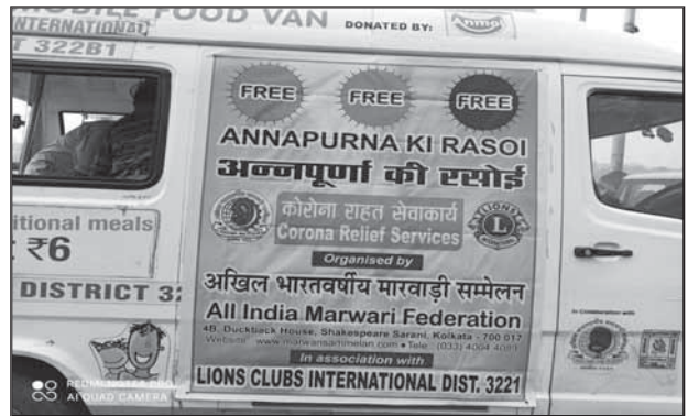
२८ सितम्बर २०२० को भूतनाथ मंदिर, निमतल्ला के निकट निःशुल्क भोजन वितरण