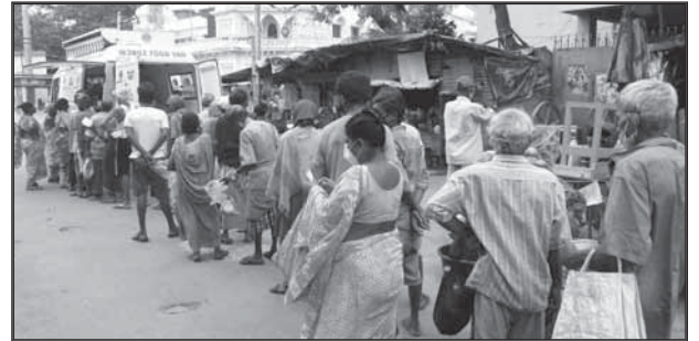
कालीघाट : ११-१६ सितम्बर २०२०