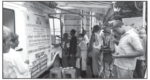
एस.एन. बनर्जी रोड (कोलकाता कॉर्पोरेशन) : १८-३० सितम्बर २०२०