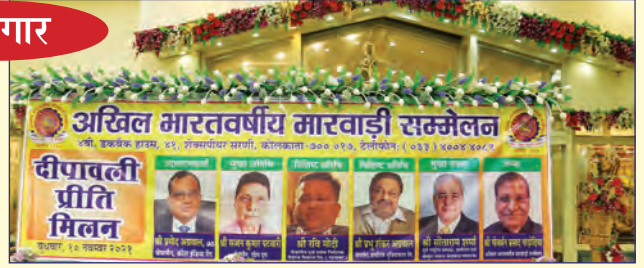
मेल-जोल एवं अतिथ्य